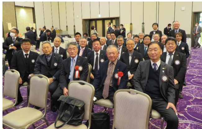
江南ロータリークラブ集合写真