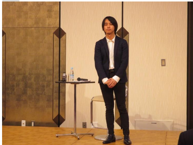
作家 青羽 悠様