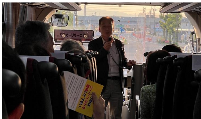
無事に江南に帰ってきました。お疲れ様でした。