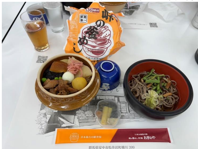
昼食は釜めしです！