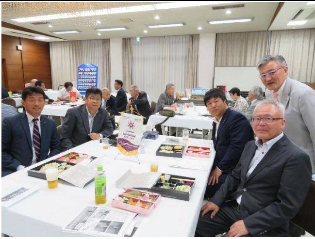
懇親会 締め御挨拶