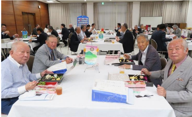
永年在籍表彰の皆様、おめでとうございます！