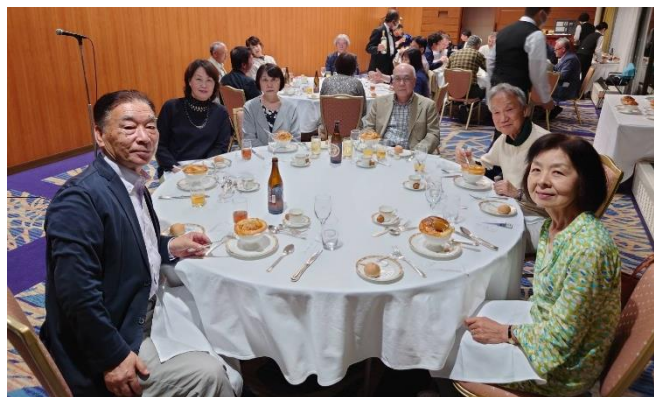
軽井沢プリンスホテルにて夕食です。