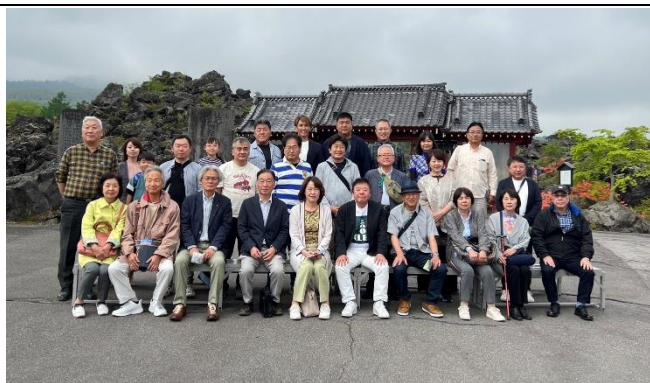
最後は全員揃っての集合写真