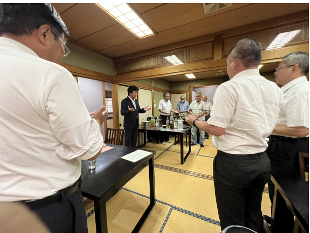
締めは南村会長エレクト