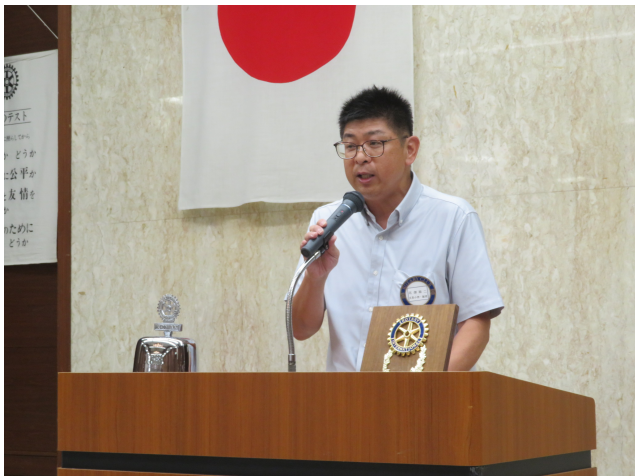
青少年奉仕委員会

実は、現地に行き知ったのですが、台湾側でこの活動をコーディネートしているのが、台北旭日ロータリークラブでした。親クラブの台北東海ロータリークラブとともに例会は日本語で行っているクラブです。私もメンバーであることを申し上げるととても歓迎していただきました。台湾のロータリークラブの話も聞けて、世界のロータリークラブはつながっているなと改めて感じました。当クラブには、台湾の潮州ロータリーと姉妹クラブの締結をしております。本年は周年ではないので訪問する事業計画はありませんが、皆さんの中で是非、訪問したいというお声がありましたら、非公式あるいは単なるメーキャップになるかわかりませんが、段取りしても良いかなと思います。またご意見を頂戴したいと思います。よろしくお願いします。