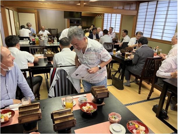
終始和やかな会でした