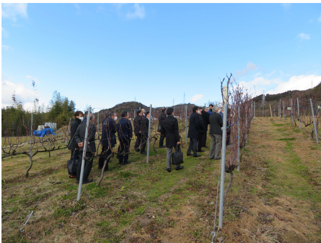
ブドウ畑を見学しました。