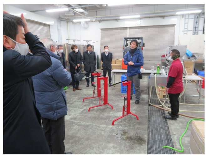
所長さんよりワイン作りについてお話いただきました。