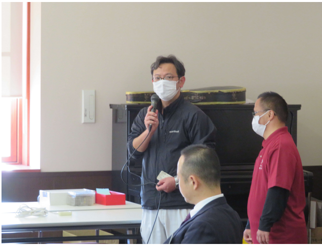
小牧ワイナリーの概要をお話いただきました。