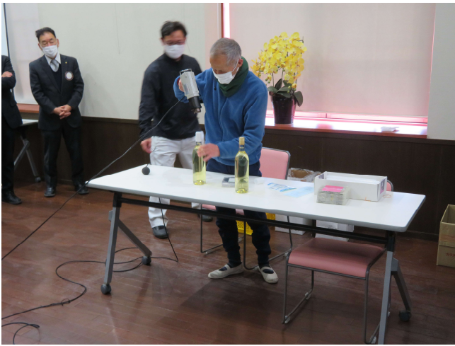
職員さんによる、ラベル張りの実演です。