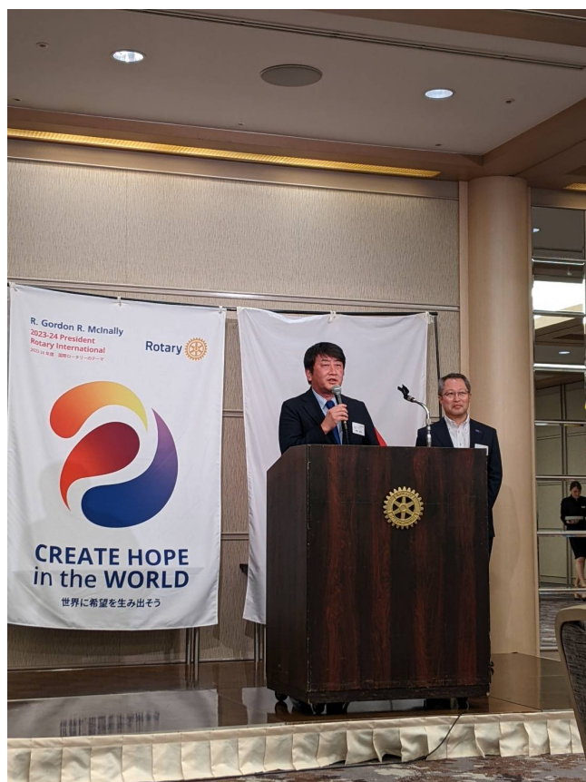
続きまして、南村会長エレクトが挨拶されました。