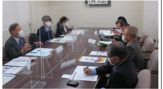
ガバナー・地区幹事・会長懇談会の様子