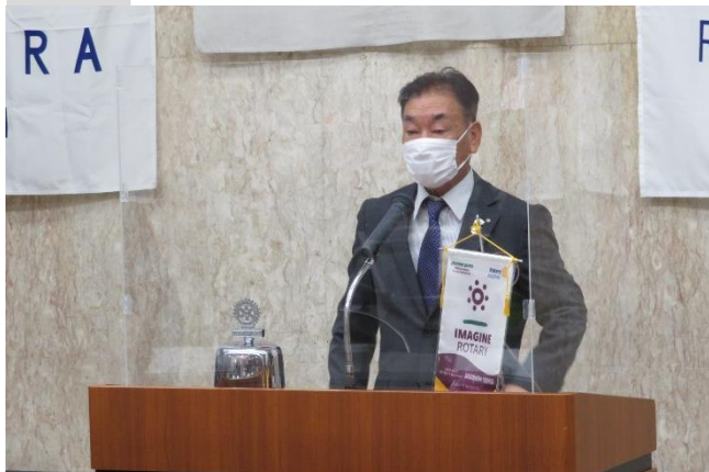
本日は2022~2023年度第2760地区箆橋美久ガ