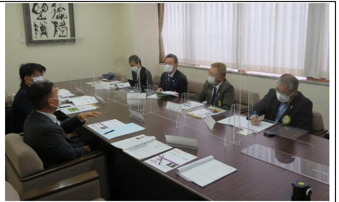
ガバナー・地区幹事・会長懇談会の様子