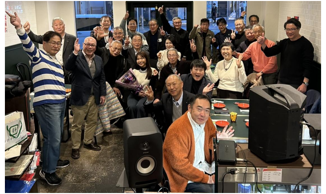
3月21日(土) 米山奨学生 ニーちゃん送別会 J's vendor KONAN DINER