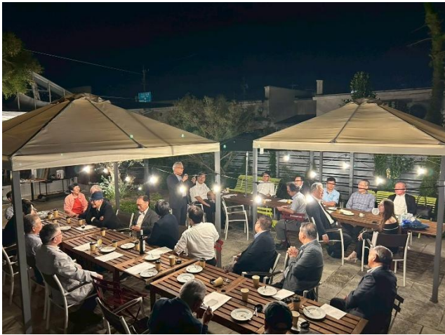
6月13日～17日 ロータリー国際大会 於:台北(台湾)